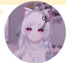
メタバース生活者 陽咲さん

バーチャルは肩書きもないし、 愚痴なども含めて思ったことを話せるから、 本当の自分はこっちだと思う。