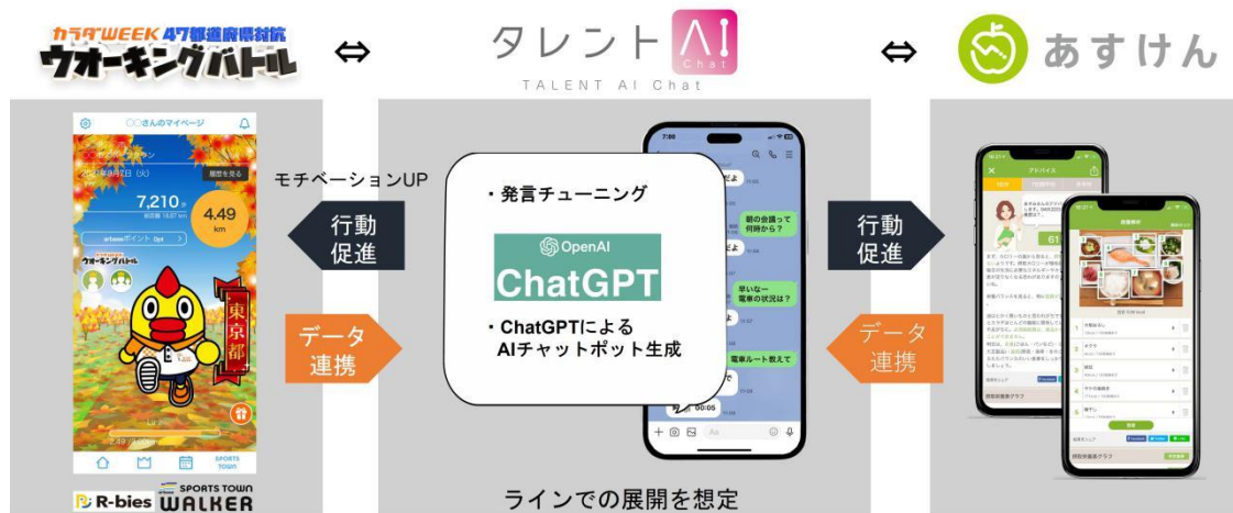
【図. 日本テレビ「カラダ WEEK」におけるタレント AI Chat 概念図】

参考：日本テレビ「2023 秋のカラダ WEEK 特別企画②「タレント AI Chat×あすけん×ウォーキングバトル」」リリースサイト https://www.ntvhd.co.jp/news/