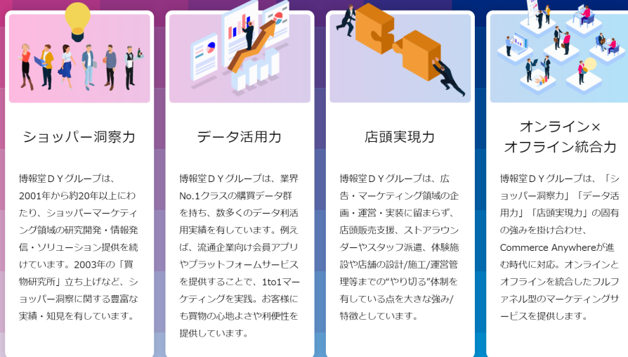
「ショッパーマーケティング・イニシアティブ™」の4つの強み