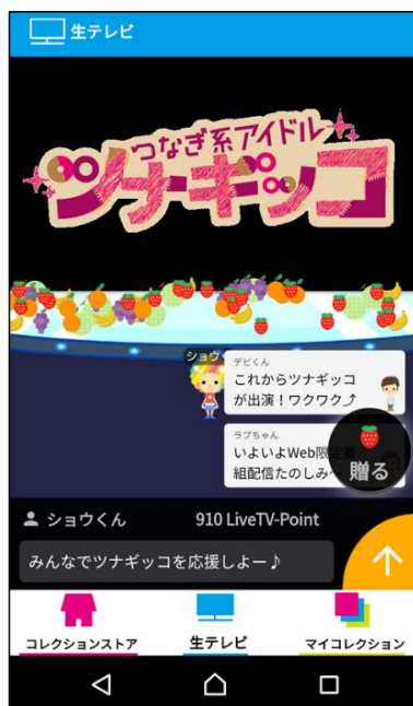
② Web限定番組視聴中にギフトング