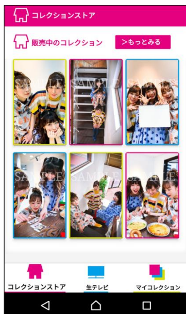
① デジタルフォトや楽曲を購入