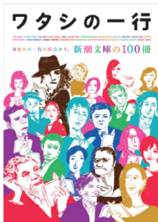
新潮社 新潮文庫（事業開発）