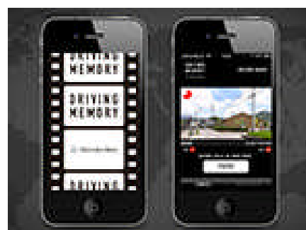
Mercedes-Benz DRIVING MEMORY（サービス・APP 開発）