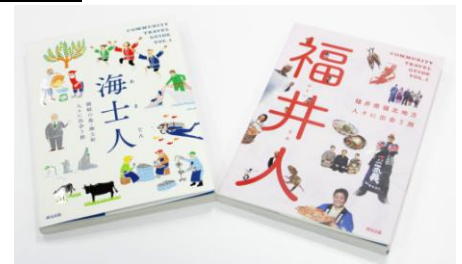
「COMMUNITY TRAVEL GUIDE」第1弾『海士人』と 第2弾『福井人』(2013年4月9日発売)

近年、国内観光のスタイルに変化がみられます。名所やグルメを堪能する旧来の「ハード消費型」の観光から、旅先で体験したり学んだりすることを楽しむ「ソフト体験型」の観光に関心が集まりつつあります。「COMMUNITY TRAVEL GUIDE」シリーズは、地域に暮らす生き生きとした人こそが「ソフト体験型」観光を支える原動力だと考え、地域の人との出会いを楽しむ旅を提案しています。