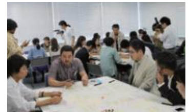
『三陸人』は地域の住民と共に作りあげます。 (※写真は前作『福井人』の制作風景)

『三陸人』で紹介するエリアは、北は岩手県宮古市から、南は宮城県石巻市までを予定しています。ガイドブックの制作は、三陸の20～30代の若者を中心とした住民の方々との協働で行います。さらに、約1年のガイドブック制作期間を通じて三陸の住民たちが出会う機会を作ること、県をまたいだ縦の連携を支援します。