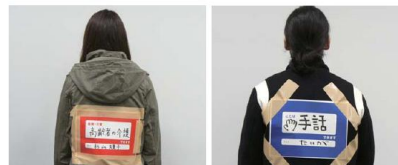
個人のスキルを可視化しボランティアを支援する「できますゼッケン」