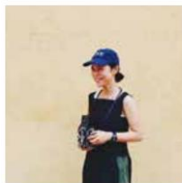
フォトグラファー ノロミホ