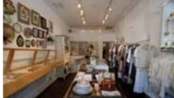
UN CINQ- vintage&handwork-