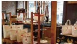
Shed That Roared