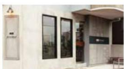
Minimal -Bean to Bar Chocolate-