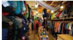
2nd hand outdoor gear maunga