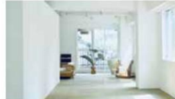
CURATOR' S CUBE