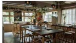
Restaurant / Gallery AELU