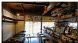
路地裏酒場 青 CORNER